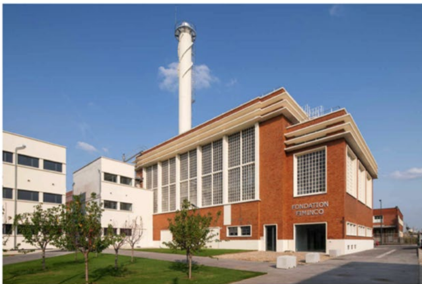
Centre d'art contemporain Komunuma par la Fondation Fiminco, à Romainville (Seine-Saint-Denis).

Nomade depuis sa création, le salon MAD (pour Multiple Art Days) s'installe cette année à la Fondation Fiminco. Rendez-vous pour les passionnés d'édition en tout genre, MAD fourmille d'œuvres à très petit prix, mais gros coefficient d'inventivité. 1 000 mètres carrés, 100 éditeurs : le regard se balade de leporello en carte de vœux, de calligraphie en sérigraphie, de livre d'artiste en jeu de société. On s'y pourvoit en mensonges en solde ou en cyanotypes ; on y déniche l'indispensable catalogue raisonné de Nina Childress ou des seins en céramique, des revues au superbe graphisme à l'image de la strasbourgeoise Talweg ou un œuf d'autruche serti sur bois par François de Coninck ; on y écoute des arbres qui parlent, ou l'on y sent de l'hydrolat de lichen grâce aux artistes du Laboratoire associatif d'art et de botanique, de retour de résidence à La Maison dans le ciel, en Lozère. Bref, l'édition au sens très pluriel ! Emmanuelle Lequeux